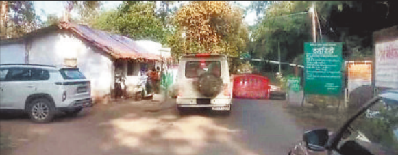
कॉफी प्वाइंट मार्ग पर लगा वन विभाग का बेरियर।

शहर के प्रमुख पर्यटन केन्द्र में शामिल व ठंड के समय पिकनिक के लिए मशहूर कॉफी प्वाइंट जाना फिलहाल खतरों से खाली नहीं है। बालको कॉफी प्वाइंट मार्ग पर हाथियों के झुंड ने दस्तक दे दी है। हाथियों की आमद के साथ ही वन विभाग हरकत में आया और आनन फानन में काफी प्वाइंट मार्ग को बंद कर आवागमन रोक दिया गया है। उल्लेखनीय है कि जिले के कोरबा व कटघोरा वन मंडल के कई वन परिक्षेत्र में हाथियों ने अपना डेरा जमाया हुआ है। दोनों ही वनमंडल