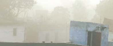
हरिभूमि न्यूज ►► हरदीबाजार

ग्राम मलगांव फेस में शनिवार को दोपहर 2.30 बजे हैवी ब्लास्टिंग हुई, ब्लास्टिंग की तीव्रता इतनी अधिक थी कि घर, मकान माली अपनी सखि सकेने लगा हो। बारूद और धूल से पूरा घना आबादी क्षेत्र पट गया। ऐसी स्थिति में लोगों के जान माल को खतरा है। किंतु एसईसीएल दीपका प्रबंधन व जिला प्रशासन इस गंभीर समस्या पर संजीदा नजर नहीं आ रहा है। लिहाजा हरदीबाजार के प्रभावित ग्रामवासी आज भी अपनी समस्या और मांगों को लेकर शांतिपूर्वक अनिश्चितकालिन हड़ताल, पैदल मार्च तो मांगों का ज्ञापन संपर्क कर जनहित व गांव हित में एसईसीएल दीपका प्रबंधन से लड़ रहे हैं। आने वाला समय ठंडी के बाद गर्मी का मौसम रहेगा तब आर गंभीर समस्या पानी की होगी तब पानी पूर्ति टैंकों के माध्यम से कर पाना संभव नहीं होगा ऐसी स्थिति में काफी समस्या होगी।