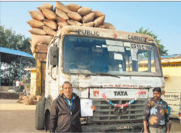
धान का किया गया उठाव।

15 नवंबर से शुरू हुई धान खरीदी के बाद उठाव के लिए राईस मिलर्स का एक पखवाड़े तक सत्यापन का कार्य प्रशासन के द्वारा पूर्ण किये जाने के बाद प्रथम चरण में 87 राईस मिल से अनुबंध किया गया है। ये वे राईस मिलर्स हैं जिनके द्वारा 70 प्रतिशत चावल नागरिक आपूर्ति निगम के गोदाम में जमा कर दिया गया है। जिला प्रशासन के द्वारा ऐसे राईस मिलर्स को पहले प्राथमिकता दी गई है जिनके द्वारा चावल जमा करने में तेजी दिखाई गई है। बीते गुरुवार को विपणन विभाग के द्वारा राईस मिलर्स से अनुबंध का कार्य पूरा करने के बाद 11 हजार 767 डीओ कोटे गये हैं। उठाव शुरू होने से जाम की समस्या