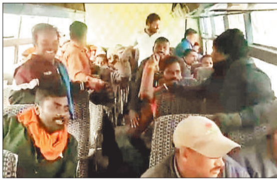
आंदोलनकारियों को बस में ले जाती पुलिस।

एसईसीएल कुसमुंडा खदान में कार्यरत नीलकंठ नामक निजी कंपनी ने स्थानीय बेरोजगारों को रोजगार पर नियोजित करने की