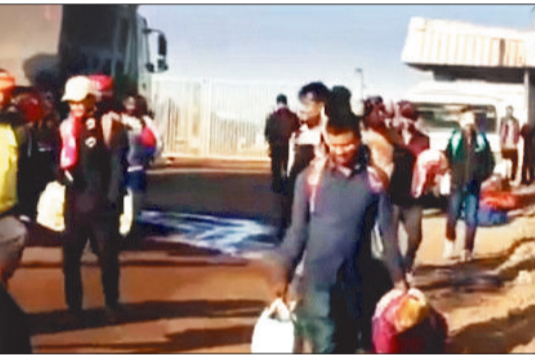
मुख्य द्वार पर आंदोलन करते हुए।

नीलकंठ कंपनी में प्राथमिकता से रोजगार देने की मांग को लेकर शनिवार की सुबह छत्तीसगढ़िया क्रांति सेना (गैर राजनीतिक संगठन) के कार्यकर्ता कंपनी के मुख्य द्वार पर धरना प्रदर्शन करने लगे, लेकिन आंदोलन शुरु होते ही पुलिस ने तत्काल हस्तक्षेप करते हुए प्रदर्शनकारियों को हिरासत में ले लिया और बसों में भरकर कुसमुंडा थाने ले जाया गया। छत्तीसगढ़िया क्रांति सेना के सदस्यों ने आरोप लगाया कि नीलकण्ठ कंपनी द्वारा पूर्व में