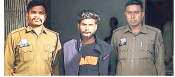
पुलिस गिरफ्त में हत्यारा।