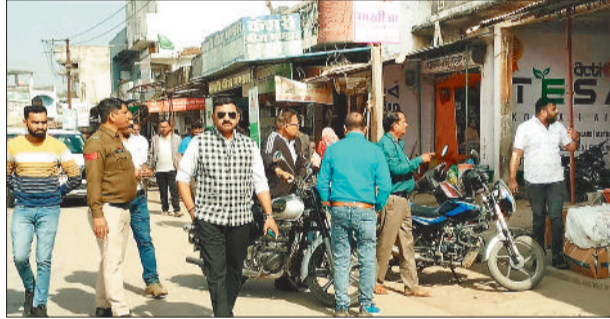
अतिक्रमण हटाओ अभियान चलाते प्रशासन व पुलिस अधिकारी।